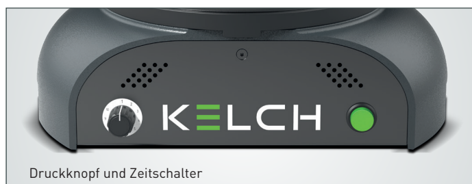
Druckknopf und Zeitschalter